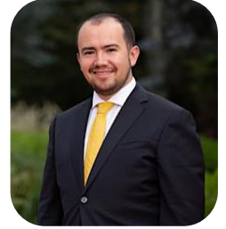
Por Jorge Beltrán Pardo.*